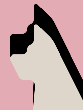
Segnalino Cane da Guardia