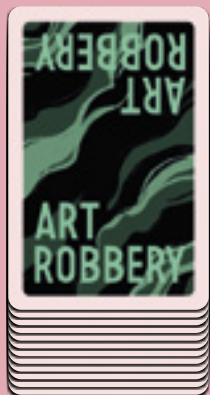
Mazzo di pesca a faccia in giù